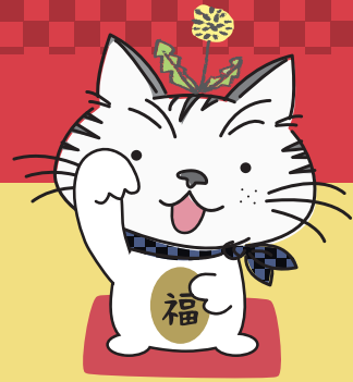
たんぽぽ猫のぽにゃってい(♂8歳)