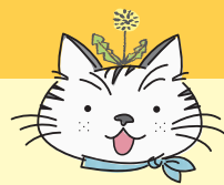
たんぼ猫の ぼしこやっぴ (♂8歳)

タテヨコのヒントを読んで解いてばにゃ! 答えは赤枠の文字を並べて完成ばにゃよ! 身近な言葉から懐かし昭和カルチャーまで! レッツエンジョイばにゃ!